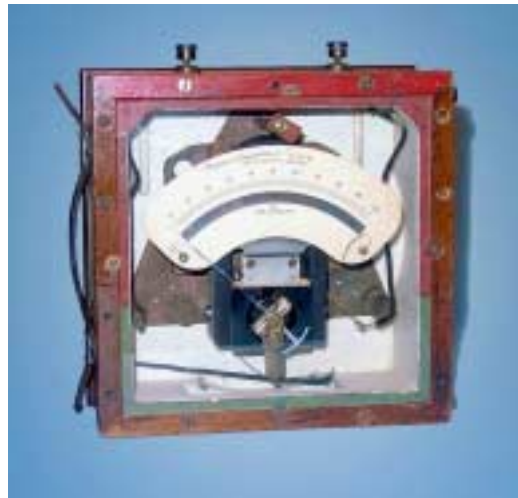
SLIKA: Levo: Princip:delovanja inštrumenta z vrtljivo tuljavico in trajnim magnetom. Desno: D'Arsonvalov milivoltmeter s permanentnim magnetom in spiralno vzmetjo več: http://physics.unl.edu/outreach/histinstr/electric.html ).